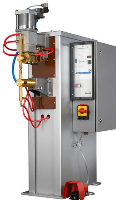
рис. серия PL

с прямолинейным ходом верхнего электрода, принадлежности для точечной сварки, пусковая ножная педаль, встроенные электрододержатели, система охлаждения.